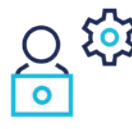
Integración y soporte de aplicaciones