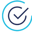
Servicios para POS inteligentes