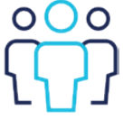
Consultoría en tecnologías de pago

Ingenico es su aliado que genera valor, ya sea para la adopción de nuevas tecnologías de pago, la actualización de aplicaciones, o para dar cumplimiento a los requisitos de certificación y seguridad.