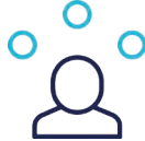
Talleres de innovación